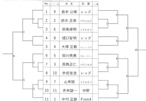
男子ベテラン 3位決定戦